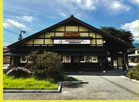
観光協会・旅の蔵